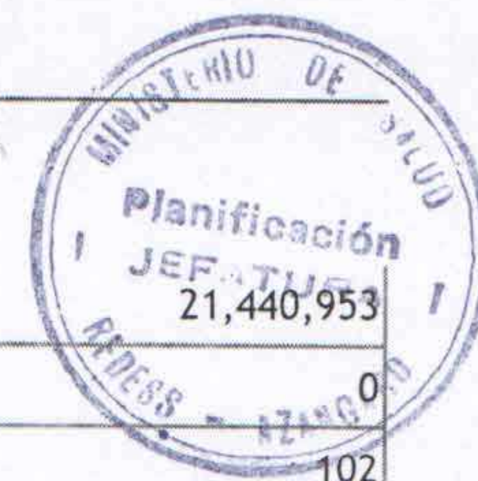
Tabla N° 1 - B: Resumen del POI modificado