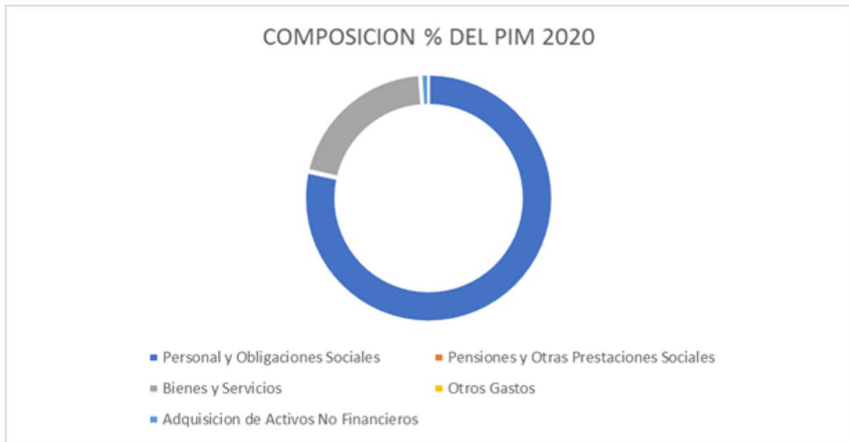
FIGURA N° 01: REPRESENTACION GRAFICA DE LA COMPOCISION PORCENTUAL DEL PIM 2020 DE LA UE. 406 SALUD CHUCUITO.