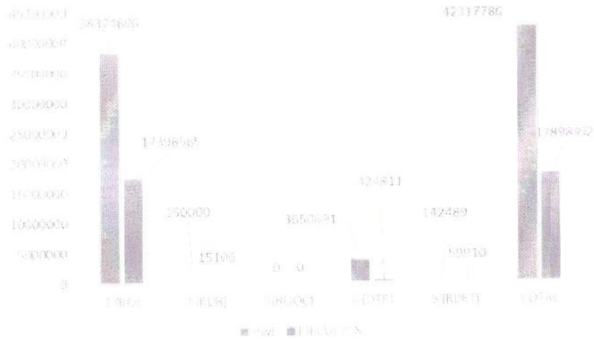
Grafico N° 2: PIM – EJECUCIÓN